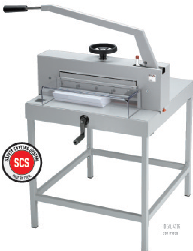
IDEAL 4705 con mesa